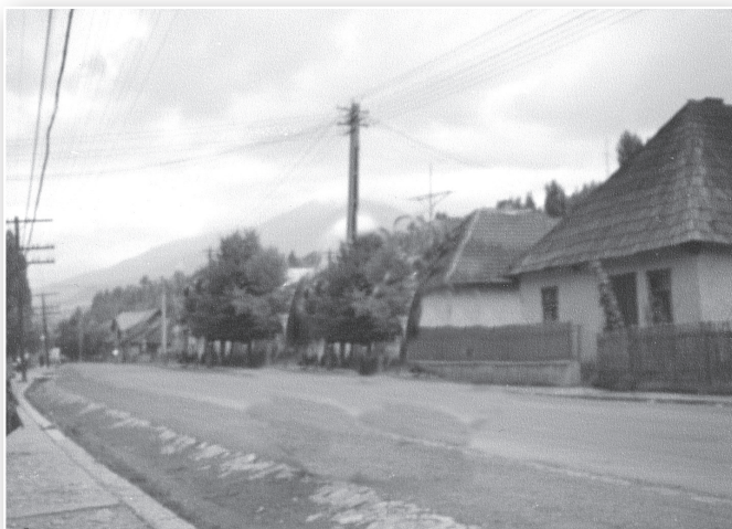
הרחוב הראשי בעיירה מאסיף

הרב שלמה יעקב גרוס, קרוב משפחתנו, מגולל בספרו הנפלא 'ספר מרמרוש' (עמ' 128-140) את תולדות ראשית התיישבות היהודים בעיירה מאסיף שבחבל מרמרוש: