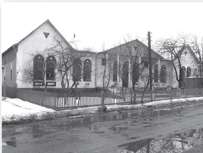
ביתו של הרה"ק בעל הצמח צדיק בויז'ניצא